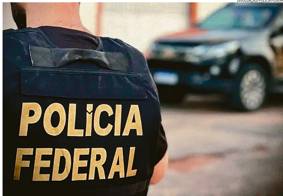
Na mira. Além do CNU, investigação da PF apura suspeitas em processos da Caixa, do BB, da UFPB e de polícias civis

Os investigados poderão responder por crimes de fraude em processo de interesse público, lavagem de dinheiro, organização criminosa e falsifi-