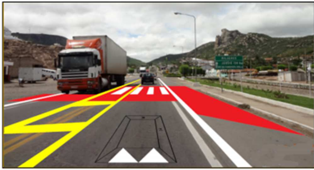
Exemplo de safety-box (Abeetrans, 2017)