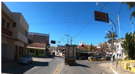
Figura 2 – Exemplo de área urbana sem vias segregadas

Considerando que ao longo do prazo da concessão poderão surgir novas travessias urbanas, e que quando não há segregação da rodovia com o tráfego urbano, a operacionalização da rodovia é dificultada, ficou estabelecido que a concessionária será responsável por operar, os serviços, conforme o grau de segregação da rodovia.