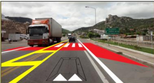
Exemplo de safety-box (Abeetrans, 2017)

As “safety-box” são definidas por uma canalização através de sinalização tipo “zebrados” sobre ambos os acostamentos, linha dupla contínua no eixo, tachas refletivas, pintura de faixa de pedestre dotada de 2 pontos de iluminação cênica sobre a faixa de pedestres, com redução de velocidade para 40km/h, além da sinalização para alerta de travessia de pedestres e linhas de estímulo de redução de velocidade na aproximação em ambos os sentidos.