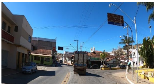
Figura 2 – Exemplo de área urbana sem vias segregadas

Considerando que ao longo do prazo da concessão poderão surgir novas travessias urbanas, e que quando não há segregação da rodovia com o tráfego urbano, a operacionalização da rodovia é dificultada, ficou estabelecido que a concessionária será responsável por operar, os serviços, conforme o grau de segregação da rodovia.