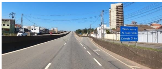
Figura 1 – Exemplo de área urbana com vias segregadas